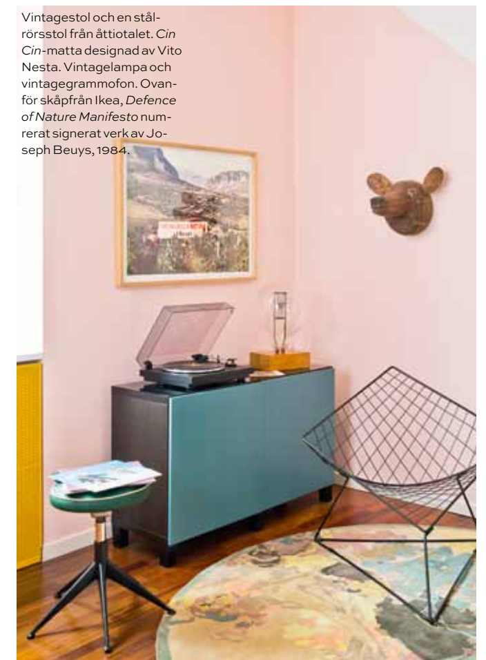
Vintagestol och en ställrörsstol från åttiotalet. Cin Cin -matta designad av Vito Nesta. Vintagelampa och vintagegrammofon. Ovanför skåp från Ikea, Defence of Nature Manifesto nummerat signerat verk av Joseph Beuys, 1984.