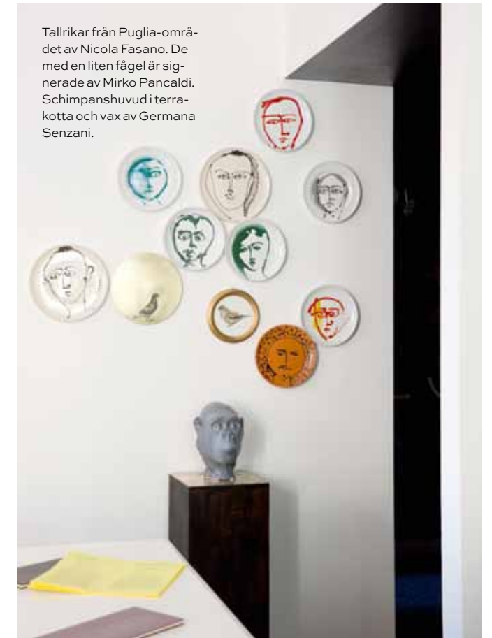
Tallrikar från Puglia-området av Nicola Fasano. De med en liten fågel är signerade av Mirko Pancaldi. Schimpanshuvud i terrakotta och vax av Germana Senzani.